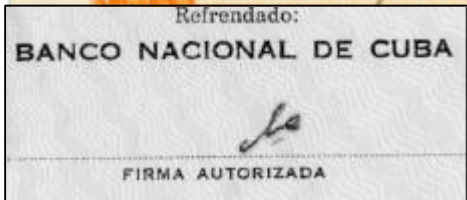
„Che“ Guevara 1928-1967