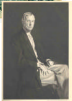
William H Rockefeller